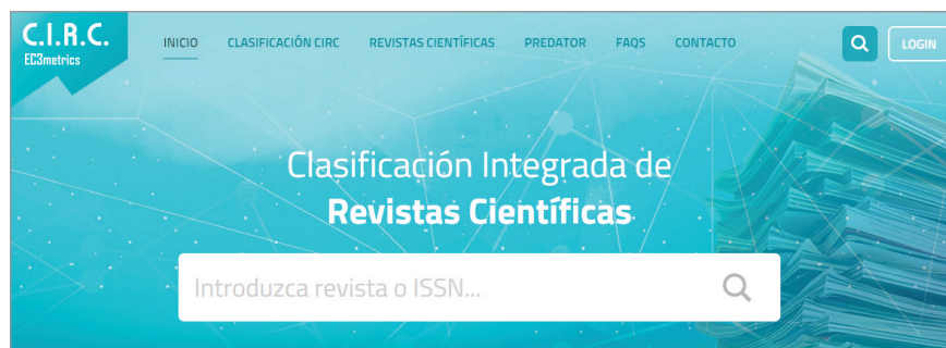
Portada de la web de la Clasificación integrada de revistas científicas (CIRC) http://clasificacioncirc.es

Un aspecto novedoso de esta edición es la presencia de más de 16.000 revistas predator , al objeto de que tanto los investigadores como los evaluadores puedan identificar estas amenazas. Las revistas han sido localizadas a través de los listados de editoriales de Jeffrey Beall (2016).